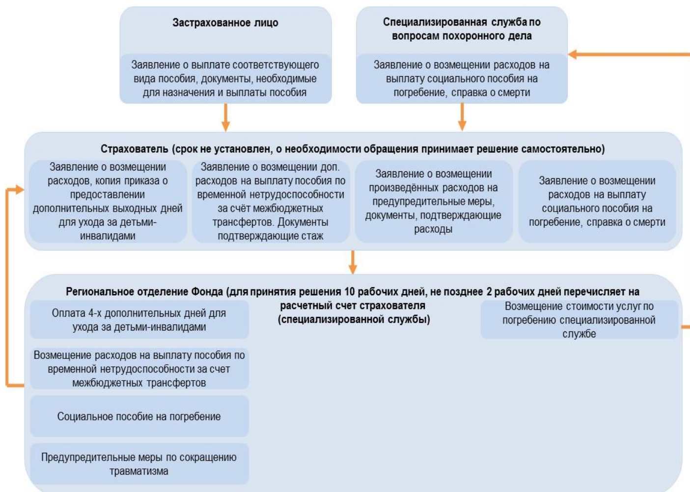
Схема возмещения расходов